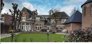
Tuin Hospice Kanaalstraat

Tot een aantal jaren geleden was het aan een uitbehandelde patiënt om thuis of in het ziekenhuis overlijden. Thuis sterven betekende een behoorlijke belasting voor de familie (als die er was...),